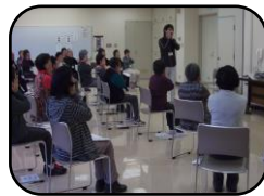
みんなで顔の体操◎