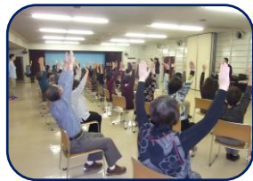
女性の参加者が多く、パワフルな一面も。