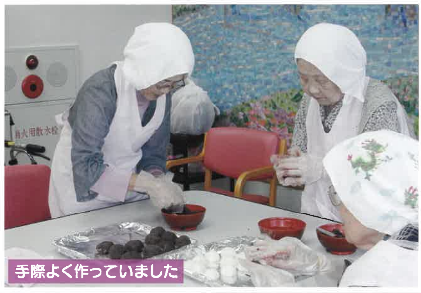
手際よく作っていました

午後の余暇活動の時間に調理活動として「おやつ作り」を行っております。そして作ったおやつは、お茶の時間に皆様で召し上がって頂いております。お彼岸の時期のぼた餅・おはぎ、そして蒸しパン、どら焼き、白玉あんみつを作りました。4～5名のグループで行い、食材を切ったり、こねたりと慣れ親しんだ作業なので、皆楽しんでおります。