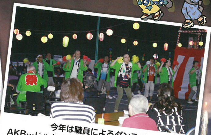
今年は職員によるダンス♪ AKB...じゃなく、LHS (ライフホーム職員) ...?? とても盛り上がりました... 見ている方も踊っていました。