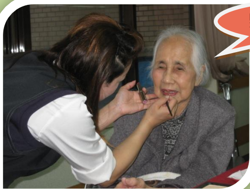
ヤクルトレディさんご協力によるお化粧の様子