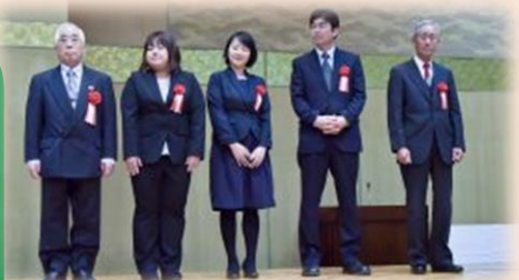
↑2/4の受賞の様子です